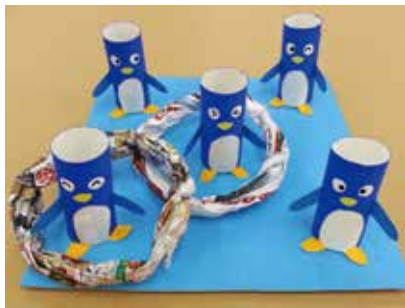
ペンギンの的を作って輪投げ遊びを楽しもう