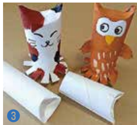
ネコとミミズクの的の作り方