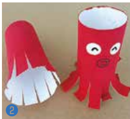
タコの的の作り方