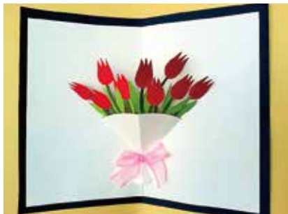
チューリップのカードは扇型の下に小さな逆さの扇型を作り、リボンをつける