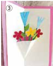
色画用紙で花束を作る