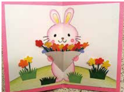
画用紙に色鉛筆やカラーペンで、ウサギなどの動物が花束を持つ絵を描くのも可愛い