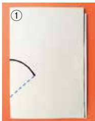
曲線に切り込みを入れる